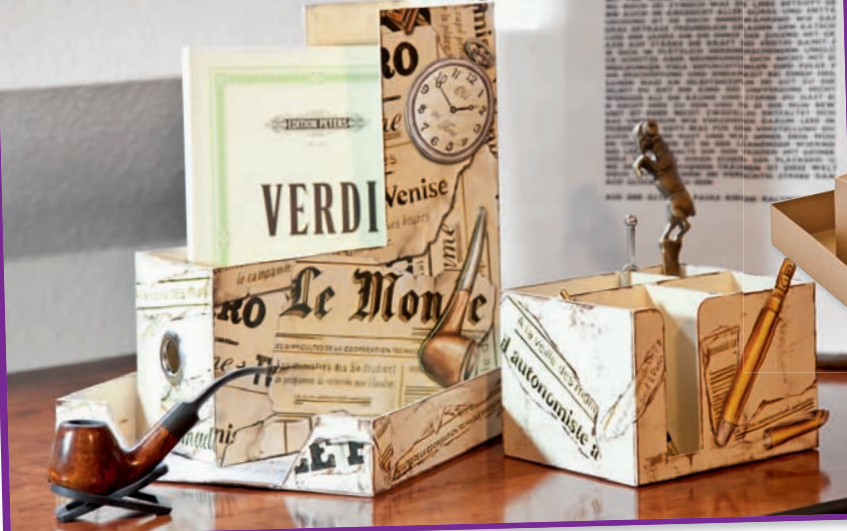
Dekobeispiel mit Decoupage-Bogen „Zeitung“