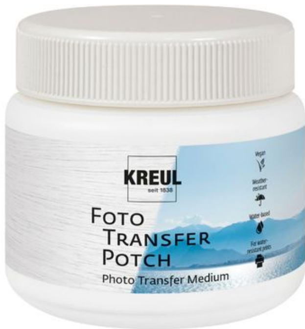
Foto Transfer Potch, 150 ml