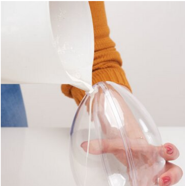
3. Gießmasse in das fest verschlossene Acrylei füllen