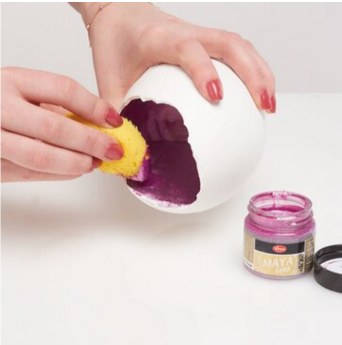
8. Metallfarbe mit dem Malschwamm auftragen