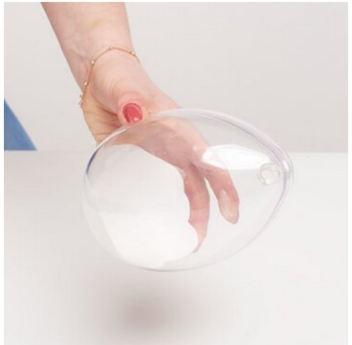
4. Acrylei bewegen bis die Gießmasse die Innenwand vollständig bedeckt