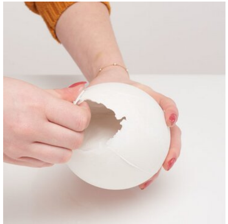
7. Die Ei-Öffnung vergrößern, einfach "Eierschale" abbrechen