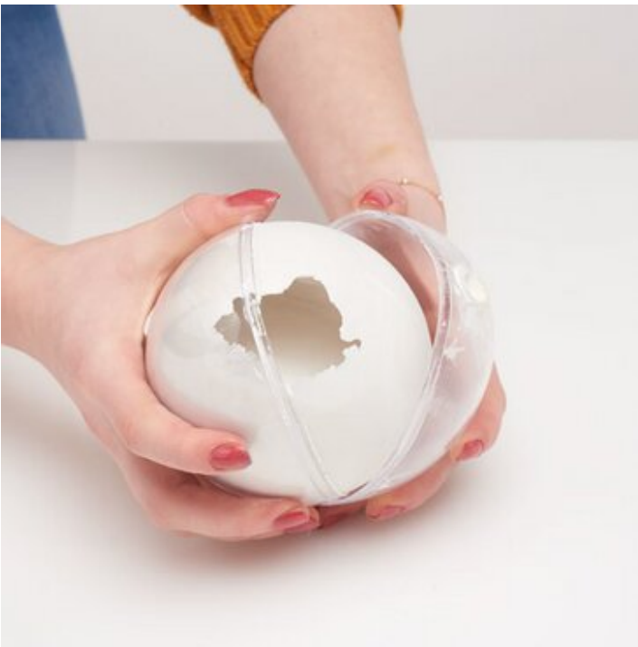
5. Vorsichtig das Gieß-Ei der Form entnehmen