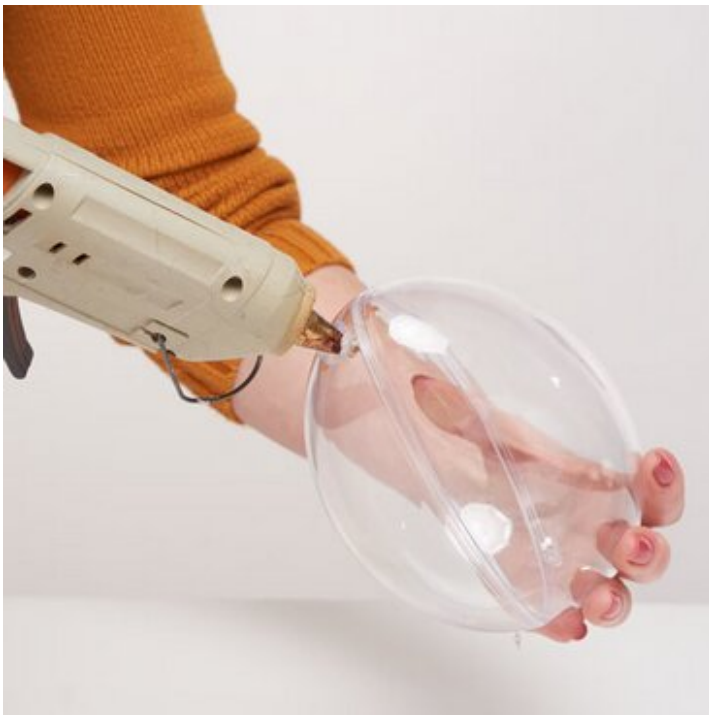
1. Einfüll-Loch in das Acrylei schmelzen