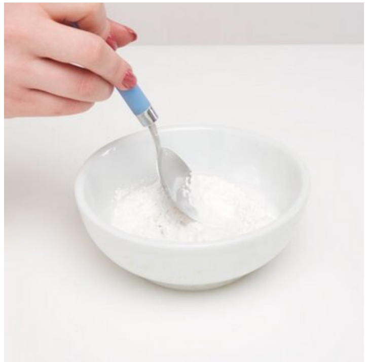
2. Gießpulver und Wasser zu einer flüssigen Masse verrühren