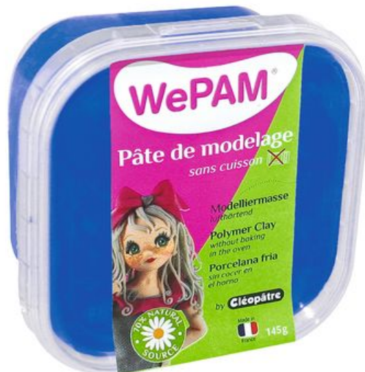
WePAM, lufthärtende Modelliermasse, Königsblau 5,19 €