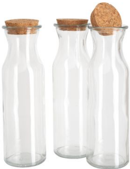
VBS Glasflaschen "Milk", 3er-Set