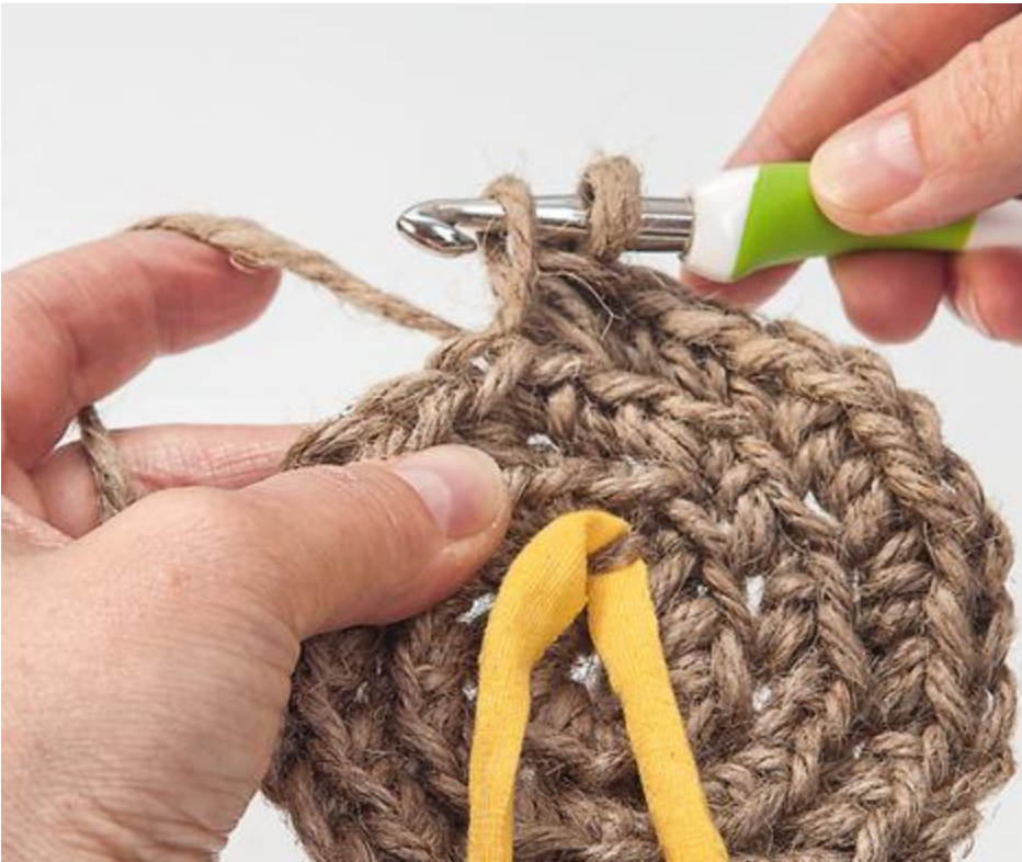
Der Boden des Häkelkorbs wird in Runden gehäkelt.