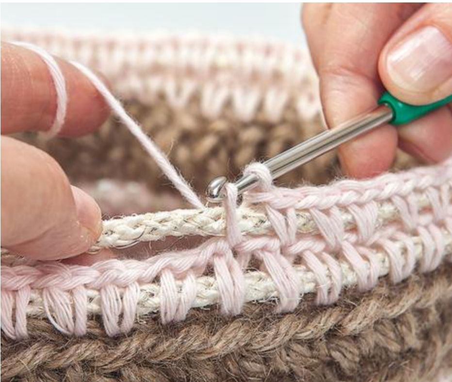
Durch das Einhäkeln von Figurendraht in in den Seitenkanten erhält der Korb seine Festigkeit.

Liebe/r Näher/in, da Stoffe Saisonware sind und wir für dich immer trendige Stoffe vorrätig haben möchten, kann es vorkommen, dass der vernähte Stoff nicht mehr in unserem Sortiment ist.