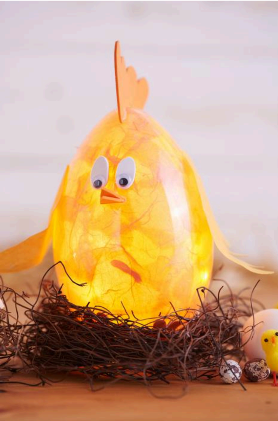
Österliches Lichtobjekt mit Hahn und Huhn

Kleben Sie weiße ovale Moosgummiformen als Augen auf das Acrylhuhn (bzw. -hahn), positionieren Sie darauf jeweils ein Wackelauge. Schneiden Sie aus dem orangenen Moosgummi den Kamm, den Schnabel und die Füße. Diese werden mit Heißkleber am Acryl-Ei fixiert. Schneiden Sie die Flügel aus der Strohseide heraus und kleben Sie sie anschließend ebenfalls auf.