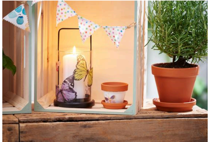
Serviettentechnik auf Glas