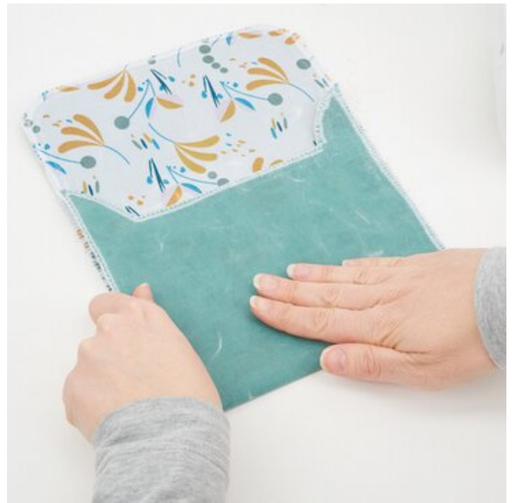
8. Tasche falten