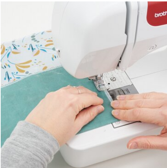
9. Taschenseiten nähen