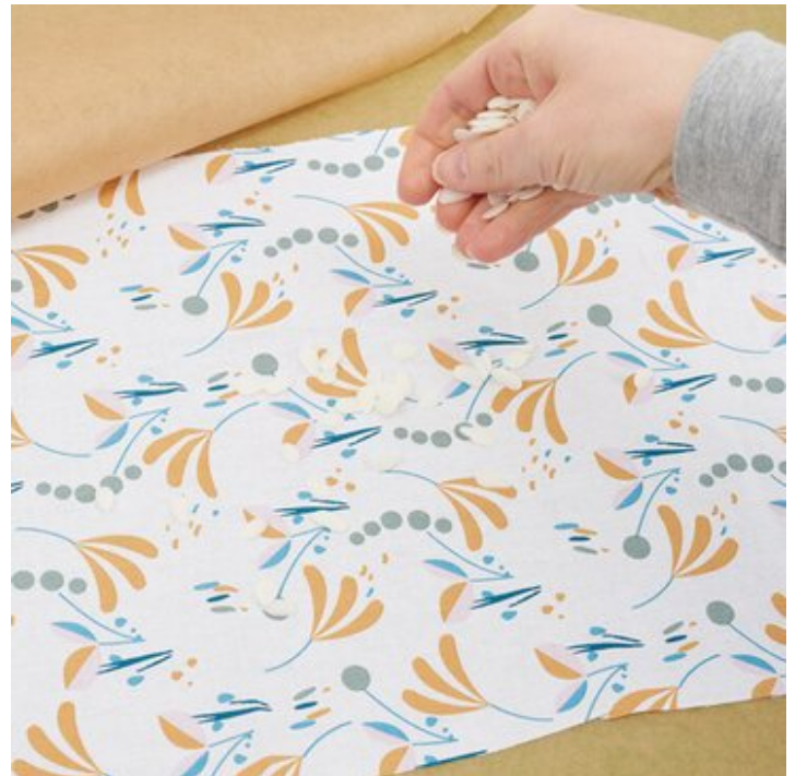
2. Mit Bienenwachs bestreuen