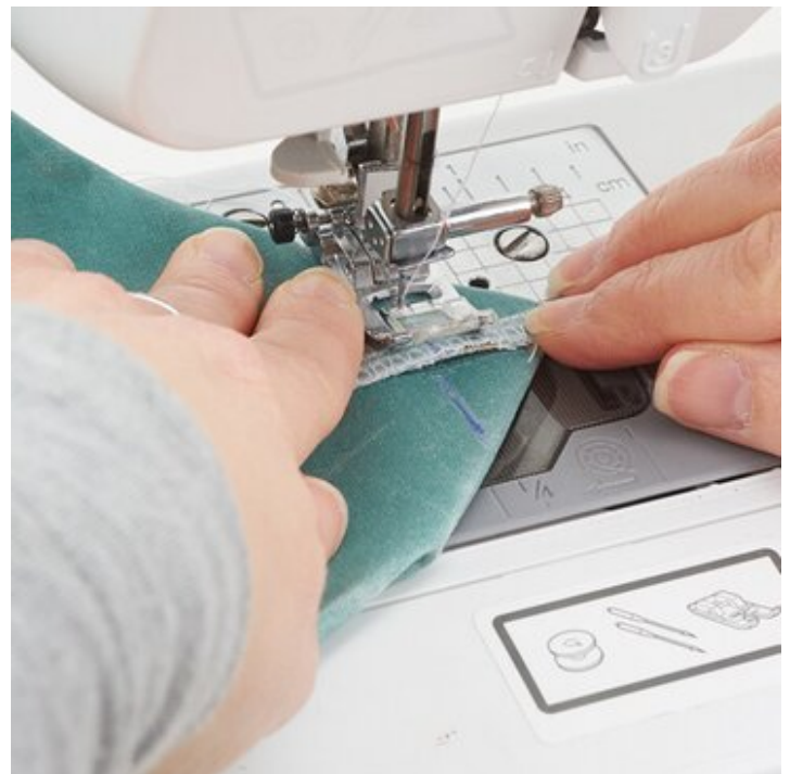
10. Taschenecken abnähen