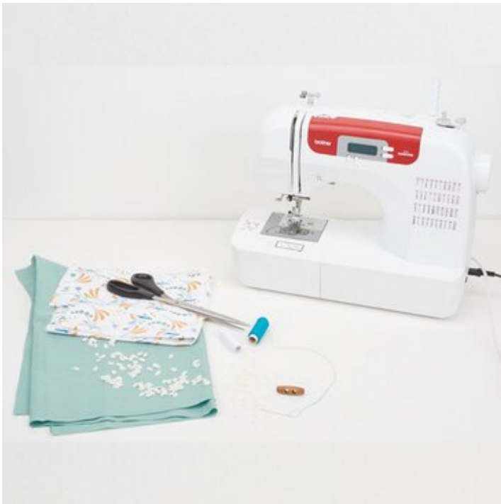
1. Material bereit legen