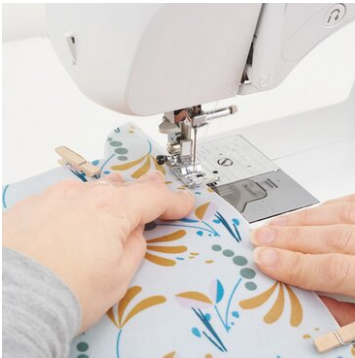
7. Zusammen nähen