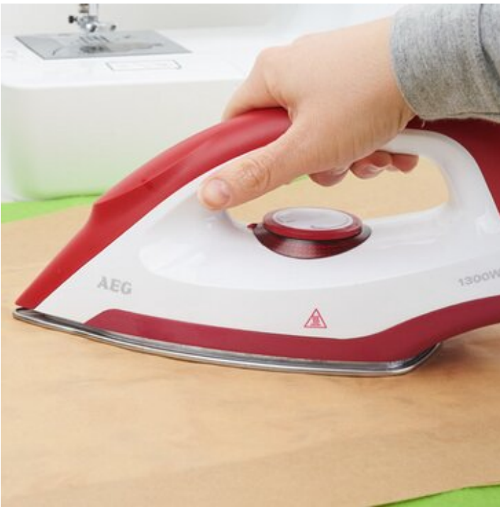
3. Wachs einbügeln