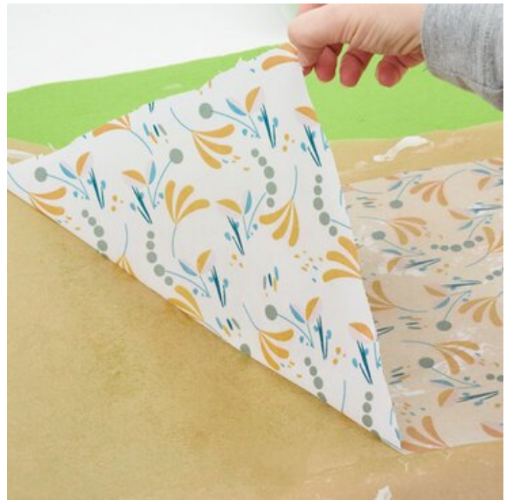
4. Stoffzuschnitt abziehen