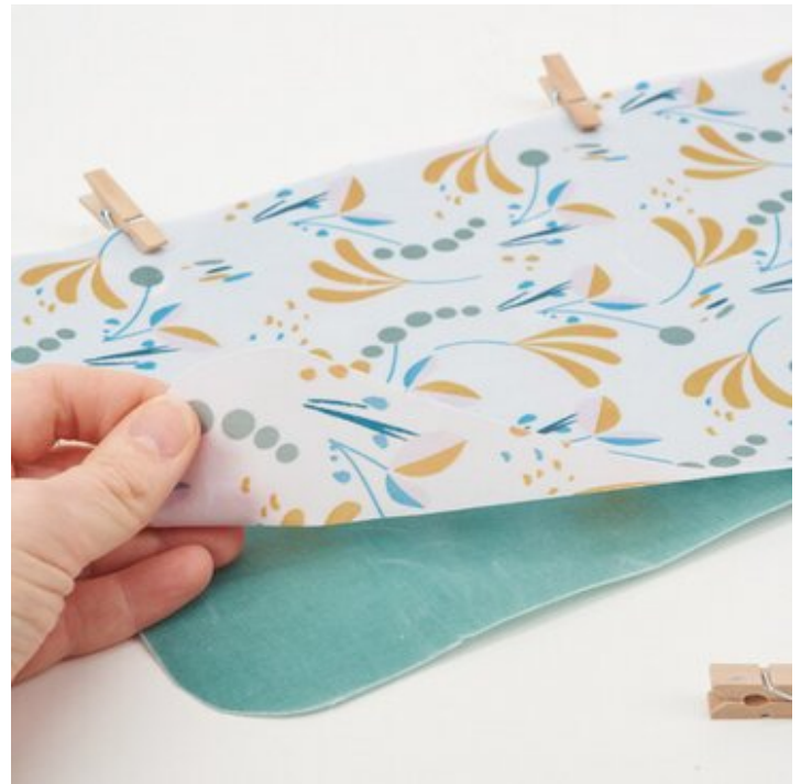
6. Zusammen heften