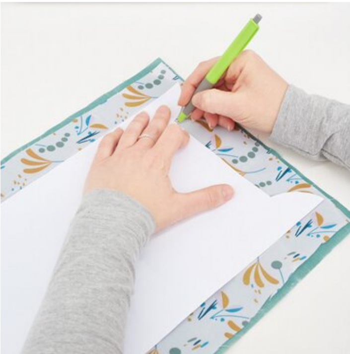
5. Stoff zuschneiden