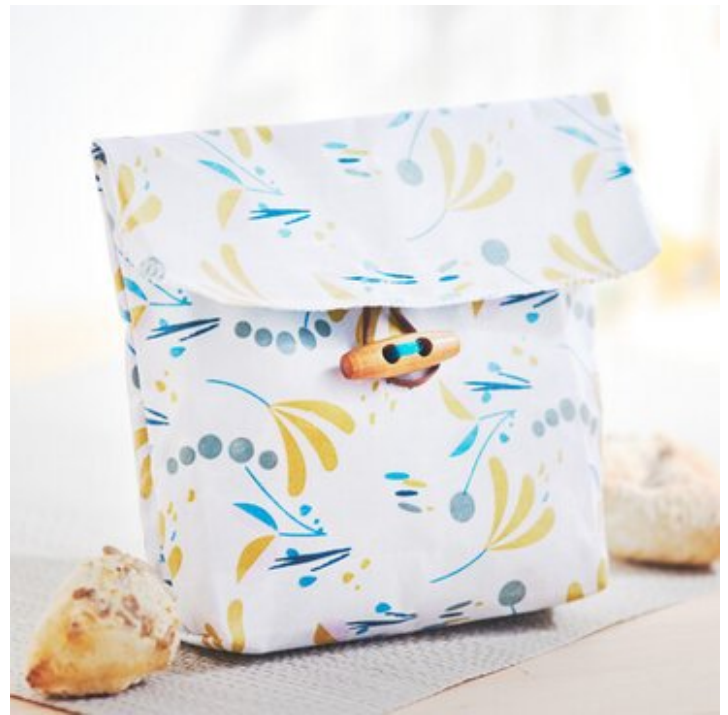
12. Knopf annähen