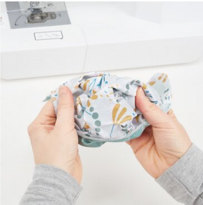
11. Tasche wenden