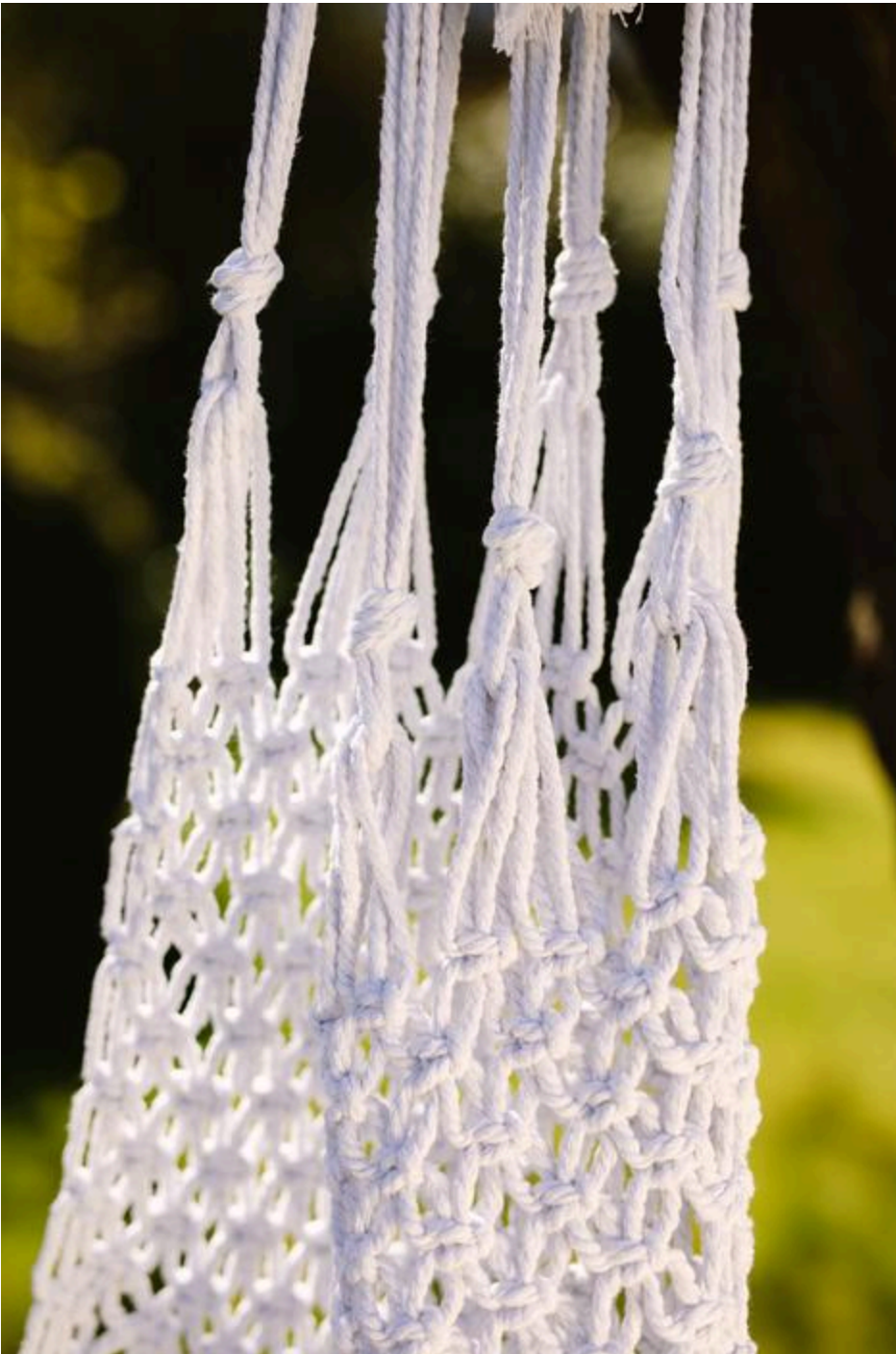
Aufhängekordeln am Makrameestück verknoten