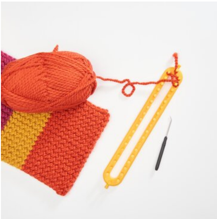
1 Start: Faden fixieren