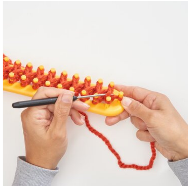
5 Wie beschrieben Reihe für Reihe weiter stricken und wickeln.