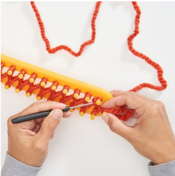
4 Zweite Masche stricken