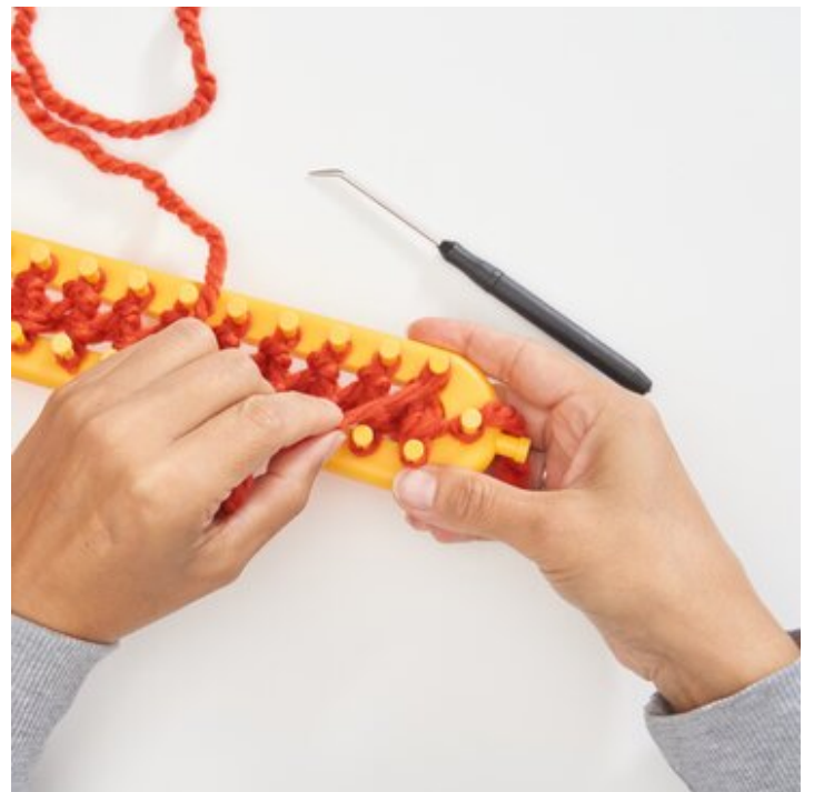
5 Neue Reihe wickeln, fortfahren.