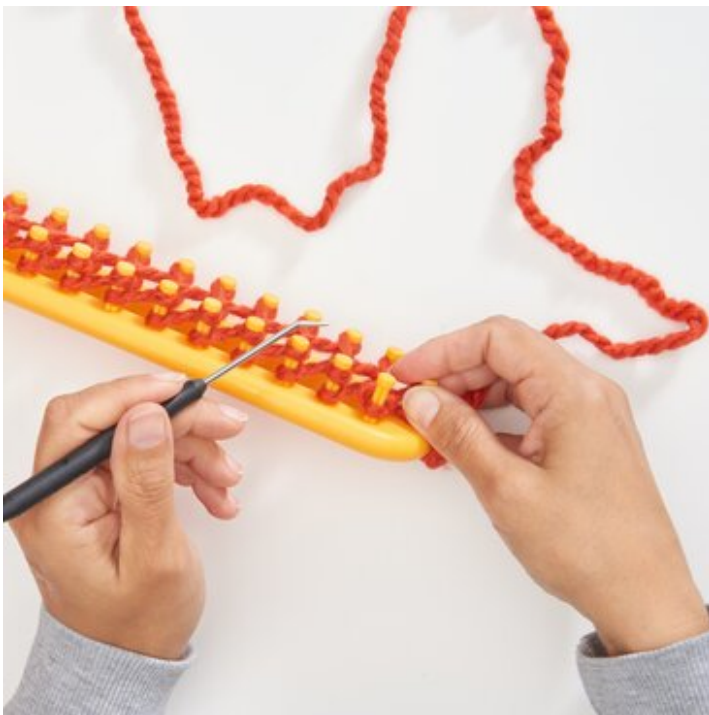
4 Erste Masche stricken