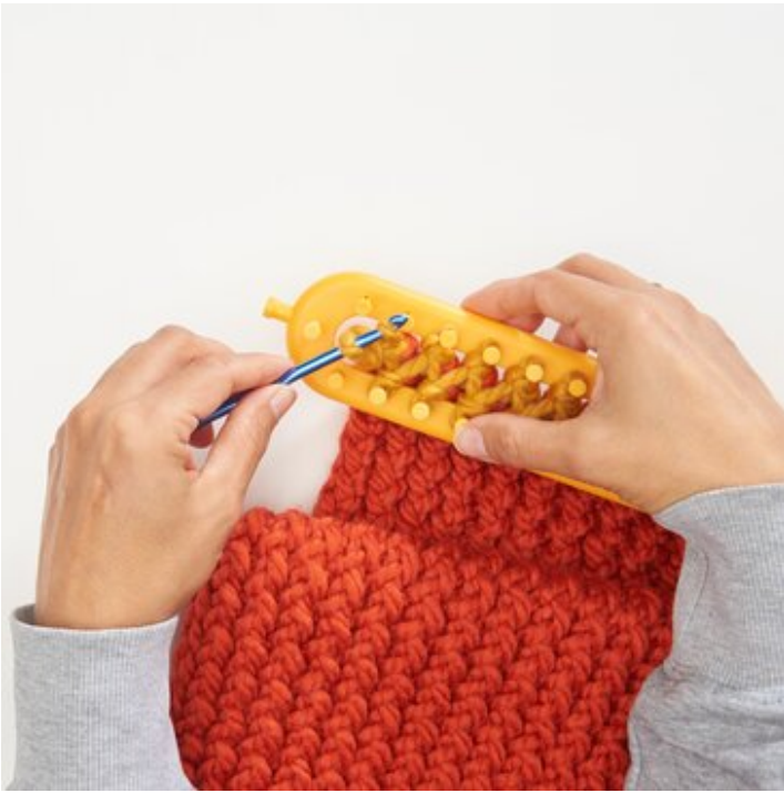
8 ..und wieder abketten.