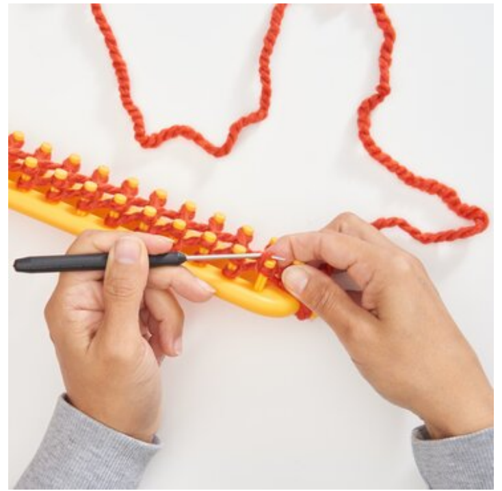
4 Erste Masche stricken