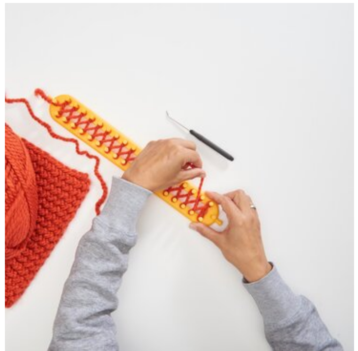
3 Weitere Reihe in entgegengesetzter Richtung wickeln