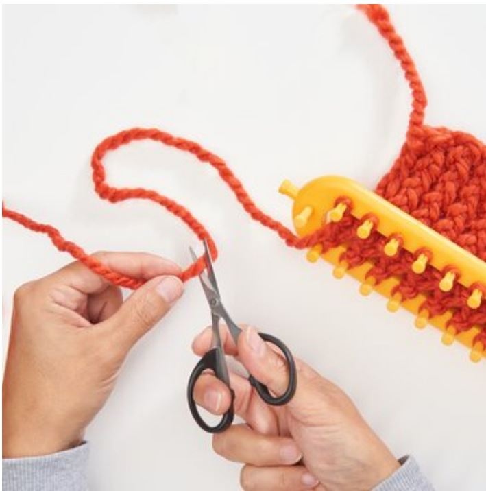
Neue Wollfarbe gewünscht?