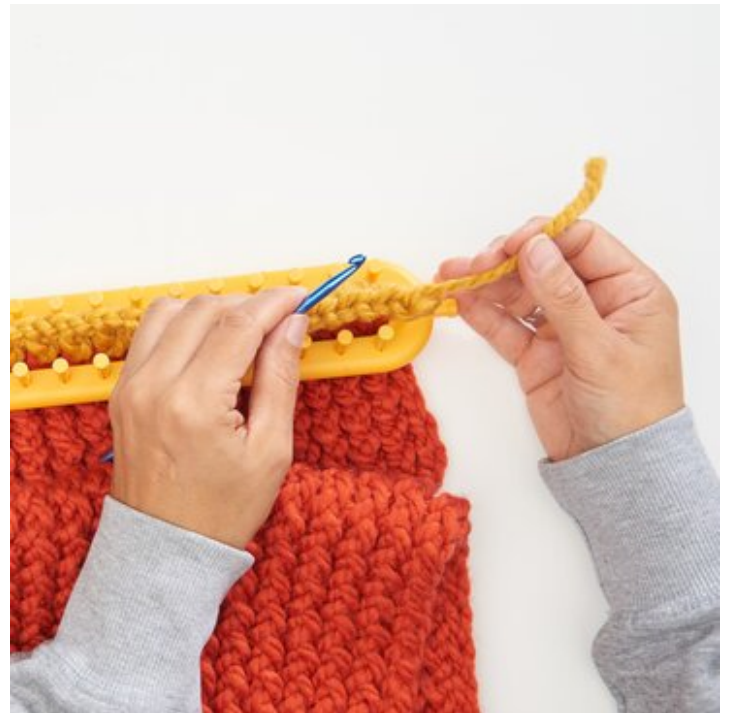
11 Schließlich das Fadenende vernähen.