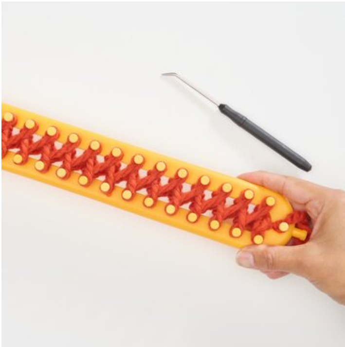
5 Bereit für die nächste Strickreihe.