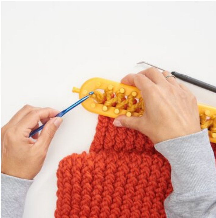
5 ...zu einer Masche zusammen ziehen.