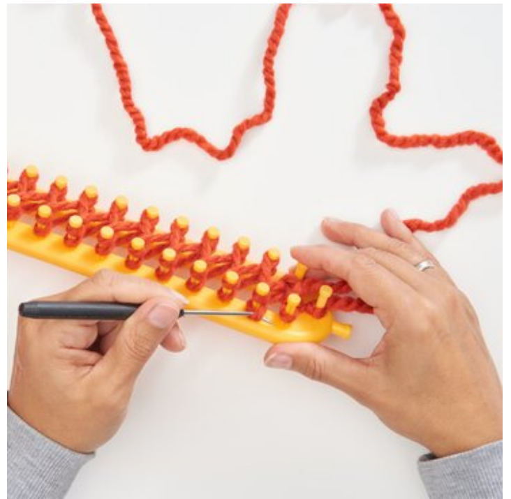
4 Dritte Masche stricken, so fortfahren.