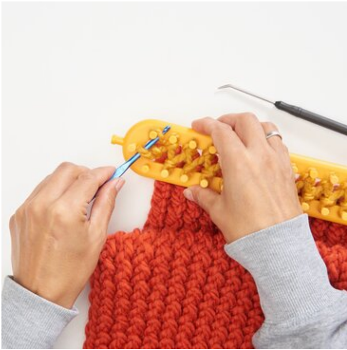
3 ...und zweite Masche auf einer Nadel.