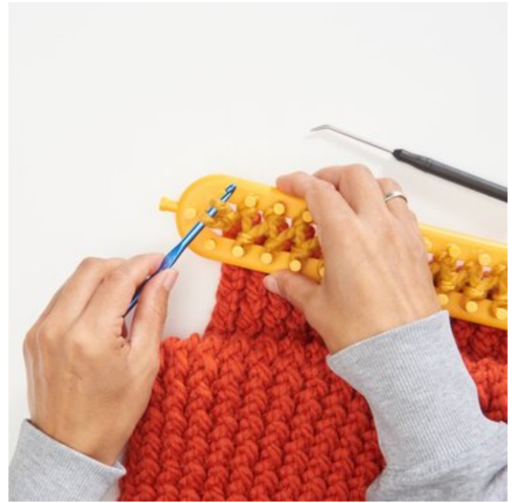
4 Beide Maschen...