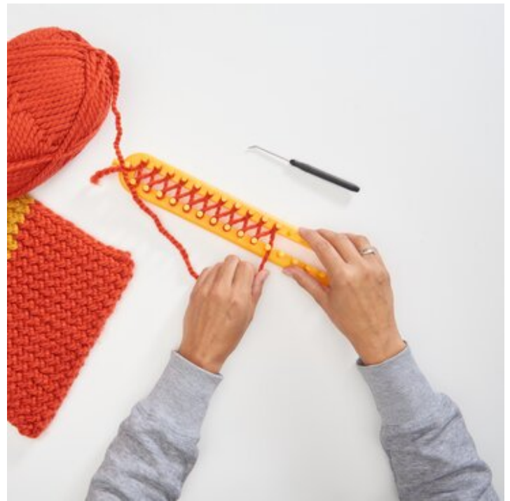
2 Erste Reihe wickeln