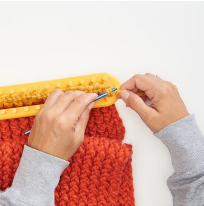
10 ..bis alle Maschen abgemascht sind.