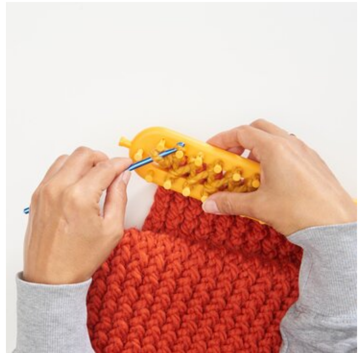
6 Nächste Masche mit der Häkelnadel aufnehmen..