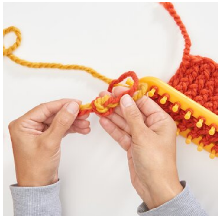
Beide Wollenden zusammenknoten...