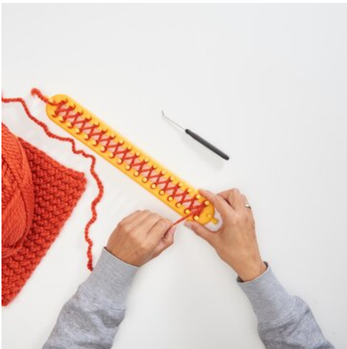
2 Erste Reihe wickeln