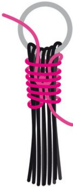
Wickelnknoten-Grafik - ©Schachenmayr