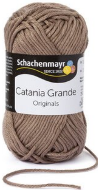
Schachenmayr Catania Grande

Die verschiedenen Makramee und Befestigungsknoten dieser Idee werden in der Original Schachenmayr Anleitung sehr genau Schritt für Schritt erklärt.