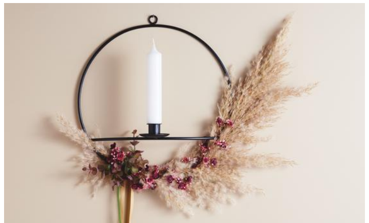
Schwarzer Dekoring mit Kerze