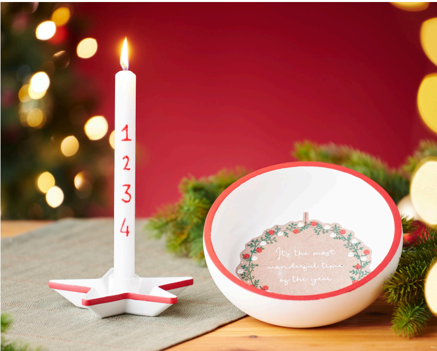
Gießidee kombiniert mit Serviettentechnik