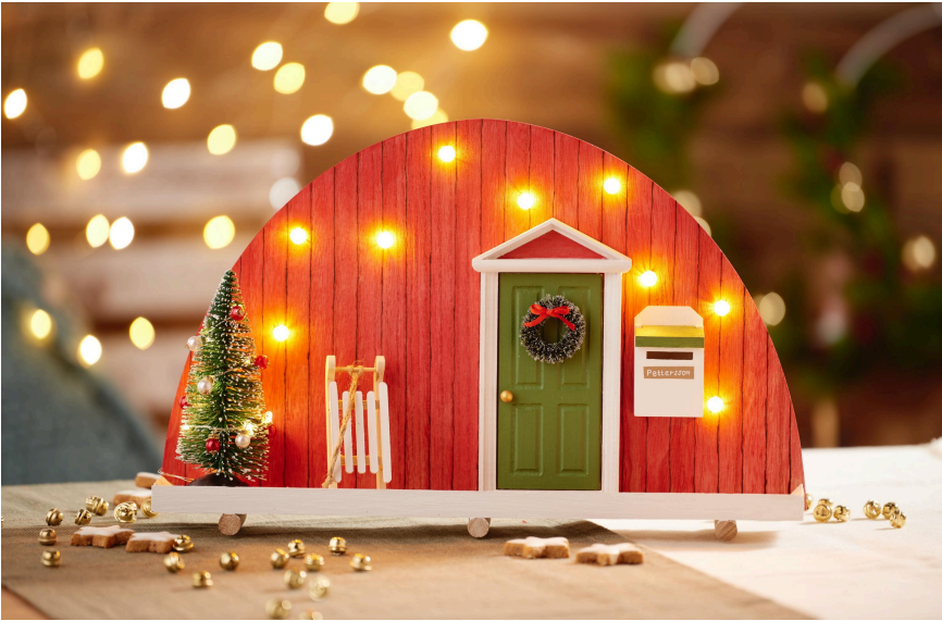
Bastelidee mit VBS Lichterbogen für 10er Lichterkette

und Weiß sowie Grün und dezente Töne in Gold und Silber. Verwende beispielsweise weihnachtliche Bastelbasics aus unserem Onlineshop und bemale sie. Nutze weiße Gießmasse oder Modelliermasse für dein Kreativprojekt. Lass dich von uns inspirieren.